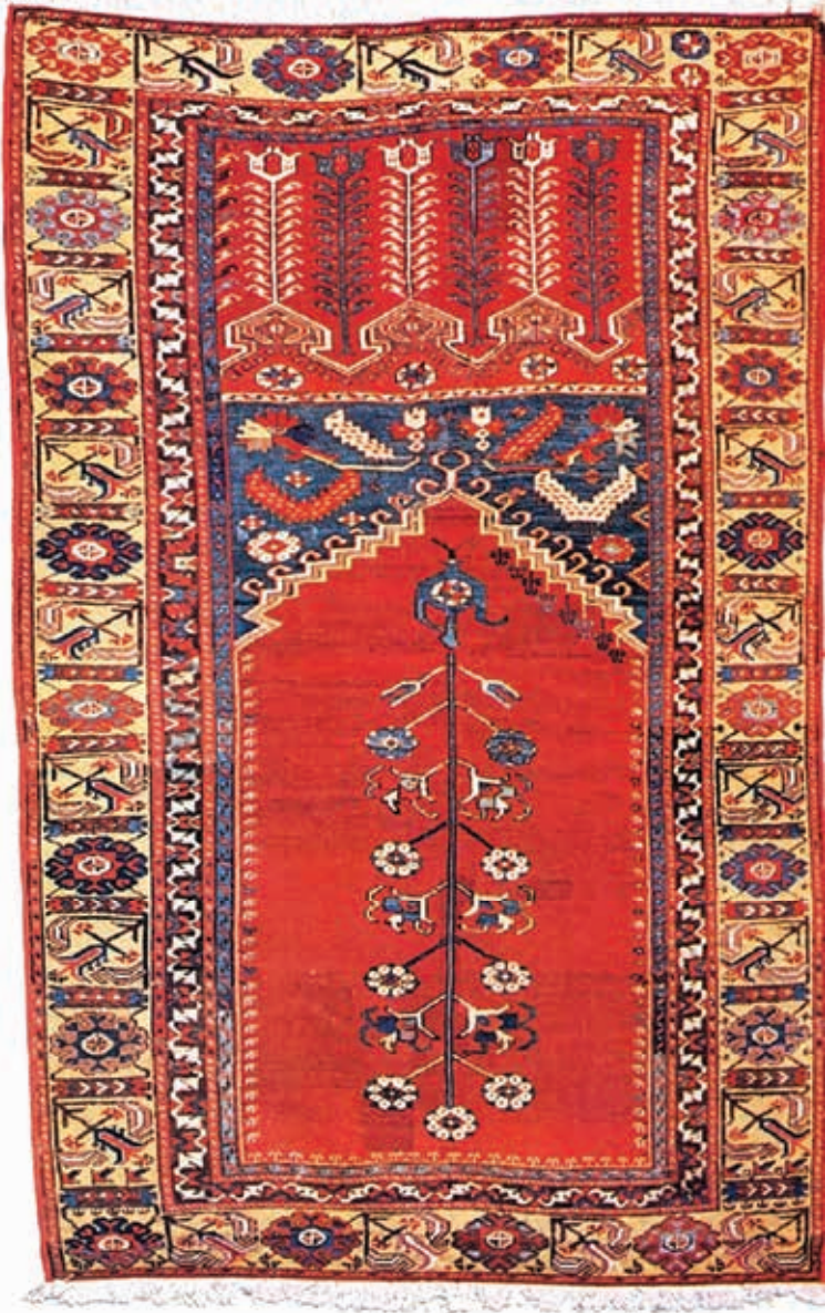
Ilustracija 3: Ladik serdžada, 18. st., 165x104 cm.