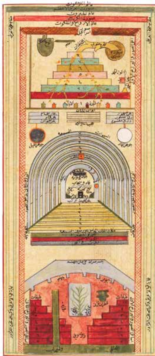
Ilustracija 13: Predstava tri nivoa stvarnosti: podzemlja, zemlje i nebesa u djelu Ma'rifatnāma Ibrāhīm Ḥaqqī Arzurūmīja. Izvor: Hüseyin Alantar, Motiflerin dili, İTKİB, İstanbul, 2007, str. 184.