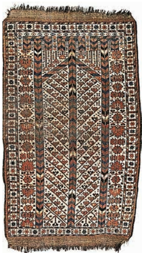
Ilustracija 9: Bešir serdžada, 19. st., 170x112 cm.