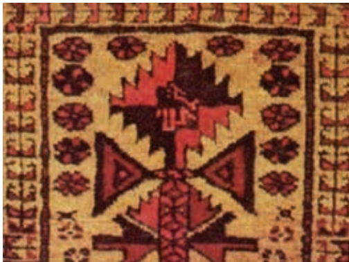
Ilustracija 11: Ibid., detalj – vrh centralnog stabla u kome je utkan izraz "Allāhu akbar"