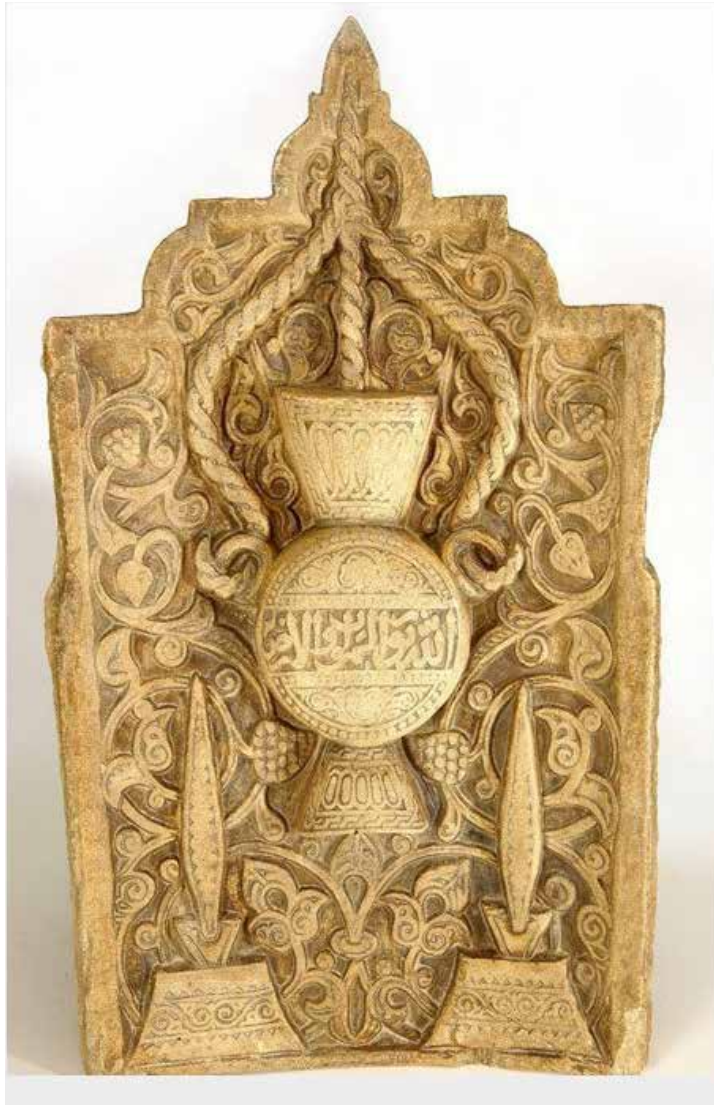
Ilustracija 1: Pljosnati mihrab s naturalističkim prikazom lampe u kome je uklesan početak 35. ajeta sure al-Nūr: “Allah je Svjetlo nebesa i zemlje”, Medresa Budayriyya, Kairo, 14. st.