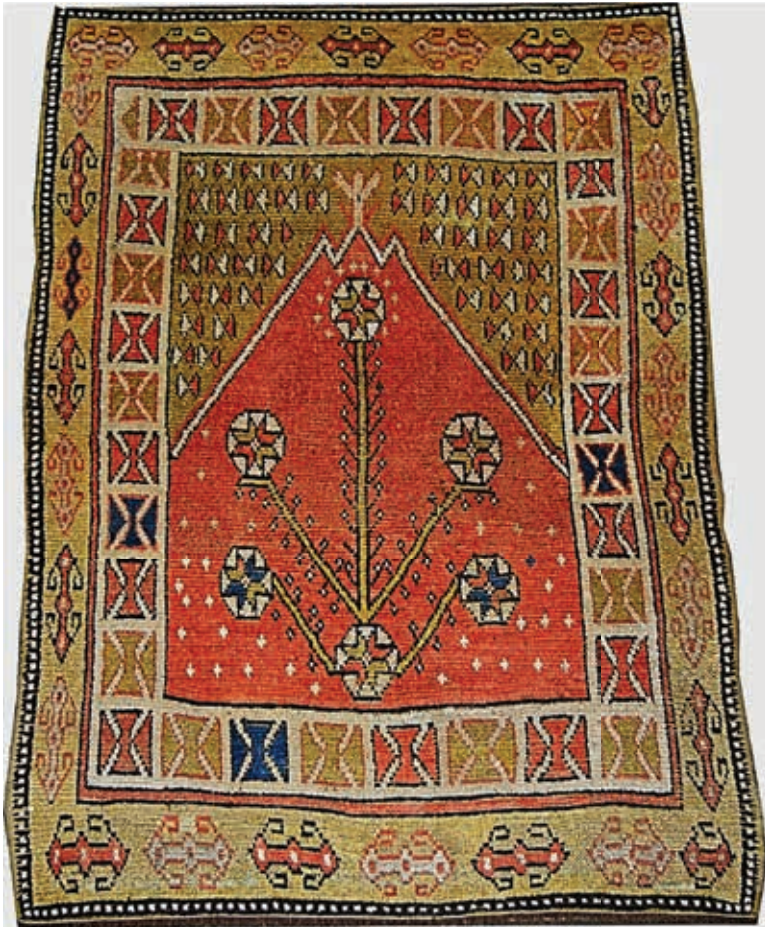
Ilustracija 5: Manastir serdžada, Balkan, druga pol. 19. st., 134x106 cm.