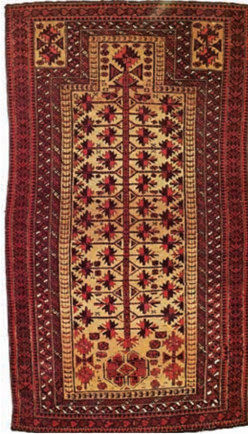
Ilustracija 10: Baluči serdžada, Horasan, 19. st., 140x78 cm, 2.495 čvorova/dm 2 , Pearson kolekcija.