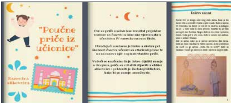
Sl. br. 10, 11 i 12. Razredna slikovnica četvrtog razreda Poučne priče iz učionice

Tokom pet školskih časova učenici su, nakon obrade nastavničkih jedinica, imali zadatak da iz pređene nastavne jedinice izvuku pouku na osnovu kojih će u drugom dijelu časa zajednički osmisлити priču. Osmišljene i zapisane priče je bilo potrebno ilustrirati za domaću zadaću. Nakon što je prikupljen materijal potreban za izradu slikovnice, uslijedilo je njeno uređivanje u Canvi.