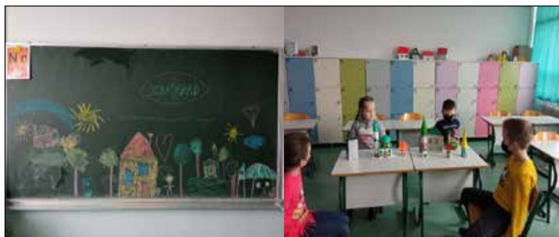
Sl. br. 3 i 4. Učenici daju ideje za priču

Na času vjeronauke su učenici osmislili priču o gradu Dobrogradu.