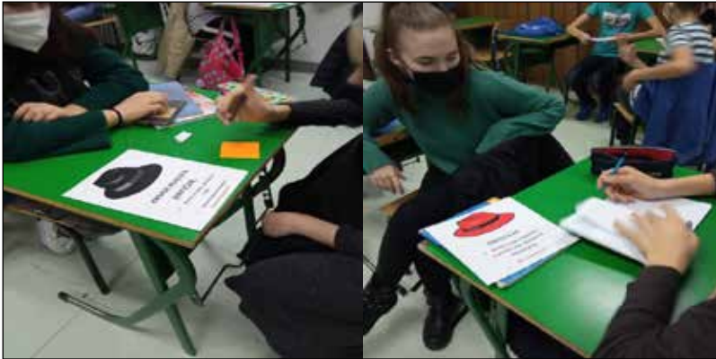
Sl. br. 13 i 14. Tok radionice "Šest šešira"