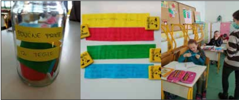
Sl. br. 7, 8 i 9. Tok radionice "Priče iz tegle"