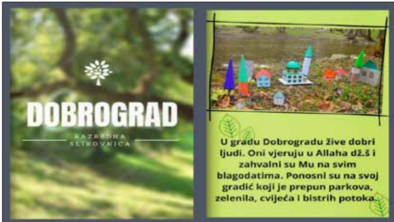
Sl. br. 5 i 6. Naslovnica i prva stranica elektronske slikovnice Dobrograd