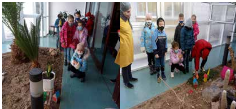
Sl. br. 1 i 2. Učenici prvog razreda fotografiraju u staklenoj bašti škole