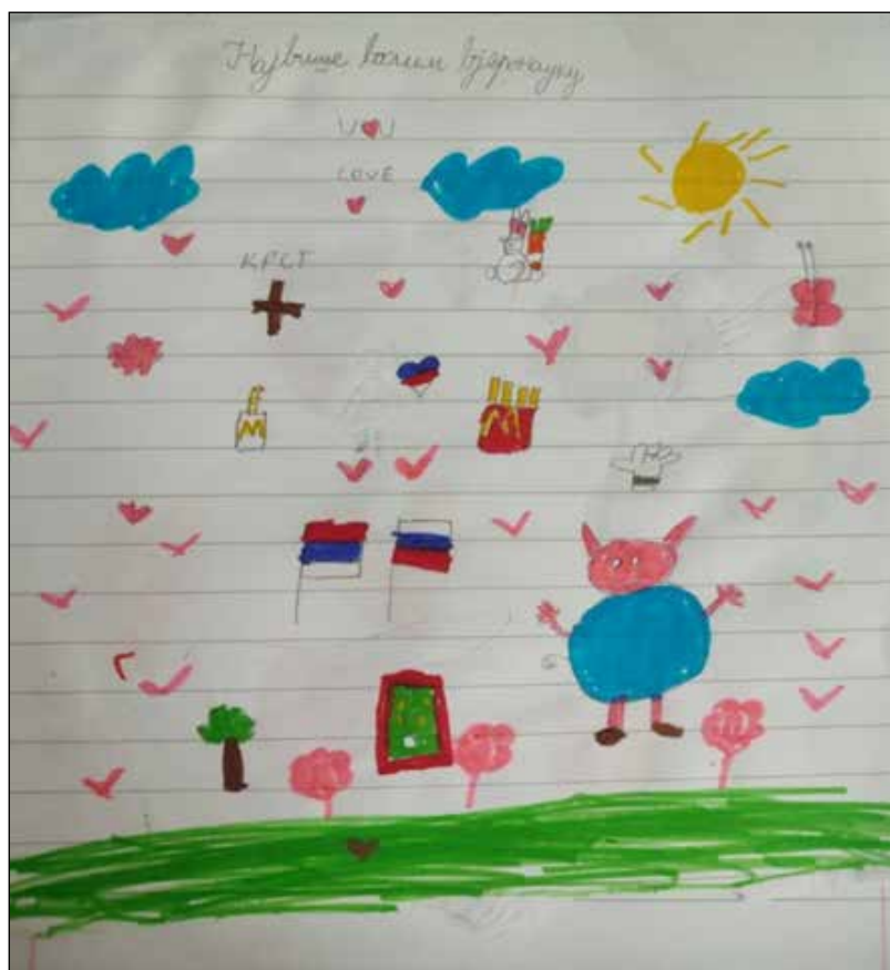
Slika br. 2. Crtež učenika drugog razreda na temu šta voli (crtež učenika preuzet od vjeroučitelja V5)